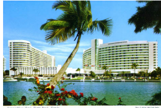
ညောင်ဦးမောင်

မိုင်ယာမီ -တဲ့။ ဒီနာမည်လေးကို ငယ်ငယ်ကတည်းက ရင်းနှီးနေခဲ့တာ။ သစ်တောတွေ၊ မြစ်ချောင်းတွေကို ခင်တွယ်တတ်။ကောင်းကင်၊ ပင်လယ်နဲ့သမုဒ္ဒရာတွေကို ချစ်တတ်တဲ့ သူတစ်ယောက်အဖို့ ကမ္ဘာကျော် မိုင်ယာမီဆိုတဲ့ အထင်ကရ လှပတဲ့ကမ်းခြေနာမည်လေးနဲ့ ခုလိုရင်းနှီးနေခဲ့တာ အဆန်းတော့လည်း ဘယ်ဟုတ်ပါ့မလဲ။ ဒီနေရာမျိုးလေးဆို ကို အရောက်သွားချင်နေမိခဲ့တာလည်း ဘယ်မှာ ထူးတယ်လို့ ဆိုနိုင်ပါ့မလဲ။ ဒီတော့ မိုင်ယာမီက ကိုယ့်အိပ်မက်ထဲမှာ နေရာယူနေခဲ့တာ။ ကြာပေါ့။ အနှစ်နှစ်အလလကတည်းက မက်နေခဲ့တဲ့ ကိုယ့်အိပ်မက်။ ခုတော့လည်း မထင်မှတ်ပဲ ပြည့်လာခဲ့ပြီ။ ကျေးဇူးပါ။ ကျေးဇူးပါလို့ ကျေးဇူးတော်များ အခါတော်နေ့အကြို ကျေးဇူးစကား အခါခါ ဆိုချင်သပ။